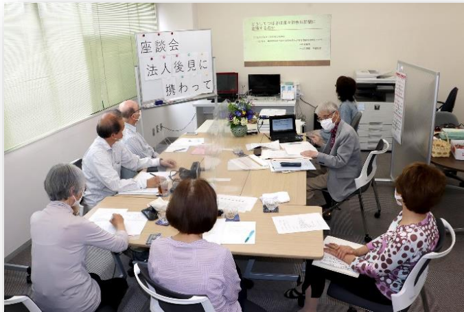
10周年記念誌「座談会」の様子

つばさは、今年10月12日で創立10周年を迎えるにあたり「実行委員会」を設け、記念事業に取り組んでいます。会員の皆様や、関係者の方々にもご協力を頂いて準備中です。