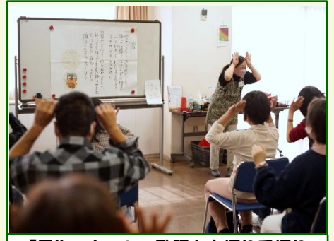
「雪やこんこ」の歌詞を身振り手振りで表現します。大盛り上がりでした！