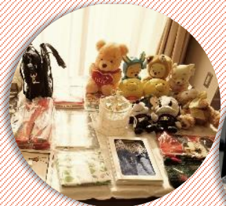
景品の数々…。迷ってしまいます。