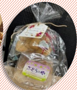
おみやげは「ぶどうの樹」(泉区)のお菓子詰め合わせ