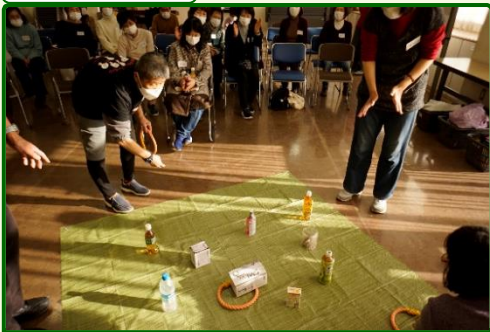
一番盛り上がりました！飲み物をゲットするため、真剣です。