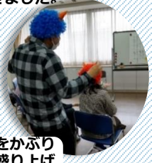
青鬼のかつらをかぶり「新年会」を盛り上げてくれました。