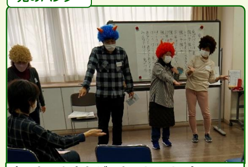
鬼のかつらをかぶった4人のリードで、ノリノリのダンス！