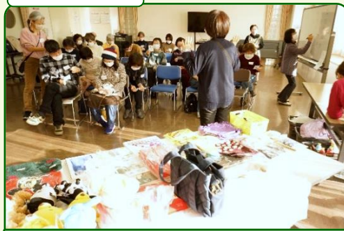
テーブルに置いた景品から、好きなものを選びます。