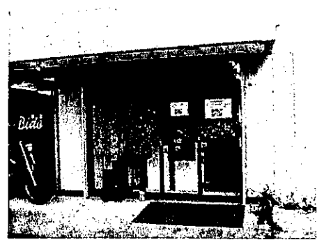
③新事務所 地域の相談拠点に