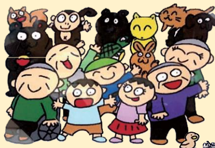
つばさの法人後見は「私らしく」を手助けします