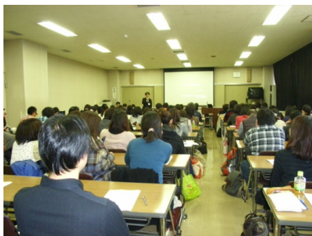
定員100名の会場（いっぱい）