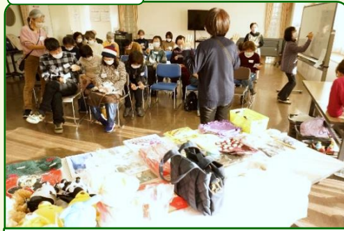
テーブルに置いた景品から、好きなものを選べます。