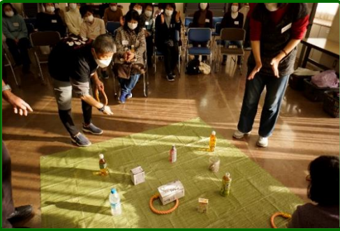
一番盛り上がりました！飲み物をゲットするため、真剣です。