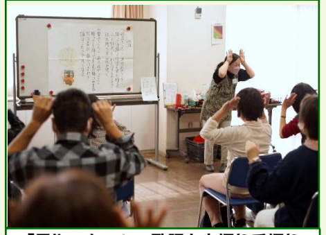
「雪やこんこ」の歌詞を身振り手振りで表現します。大盛り上がりでした！