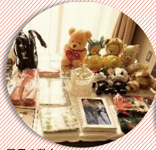
景品の数々…。迷ってしまいます。