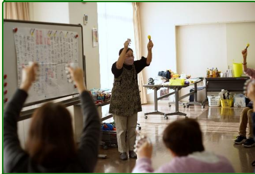
マラカスと鈴で大合奏！即興なのにみんな上手。ミニコンサートみたいでした♪