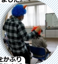
青鬼のかつらをかぶり「新年会」を盛り上げてくれました。