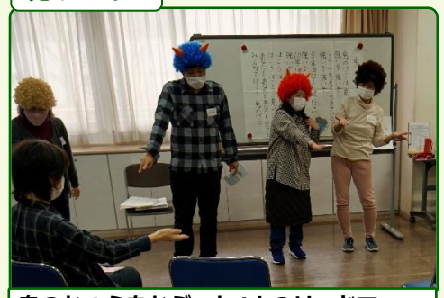
鬼のかつらをかぶった4人のリードで、ノリノリのダンス！