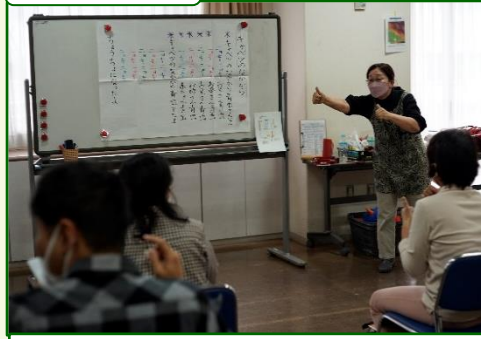
「キャベツの中から青虫出たよ〜♪」手指を使い、頭の体操になりました。