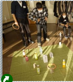
わなげで、AKBグッズをゲットできました。

つばき新年会、ヨシコウケン 今日は、雪の歌でも良かったです。雪やこんこには、北の国、北を思い出して、寒い日本の北国もよくて、昔、北の国、北の国が走った道を思い出して、鬼のパンツ、昔のヨシコウケンを思い出して、AKBグッズをあげて、うれしかった。今日はみなさまありがとうございました。 ヒメコ びわの ヨシコウケン