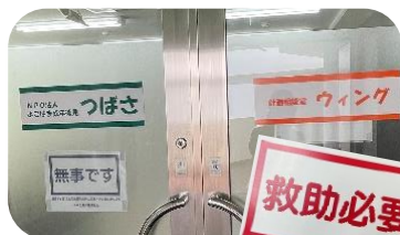
↑ 「無事です」(青)を貼ったドアと、「救助必要」プレート(赤)ドアの内側には、「避難する時の確認事項」を貼っています。