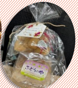
おみやげは「ぶどうの木」(泉区)のお菓子詰め合わせ