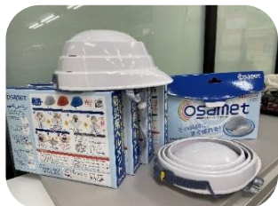
↑ 「防災用折りたたみヘルメット」を事務所に用意しました。

つばさ事務所として「消防計画」で、執務中に災害発生した時の対応や避難について定め、消防署に提出しています。また、大規模地震など大災害が発生した時の利用者さんやメンバーの安否確認は、担当者とスーパーバイザーが協力して情報収集を行い、チームリーダーが集約し事務局(対策本部)へ報告します。必要な応援体制を取るなどの対応マニュアルを作成し、メールや担当者会議でお知らせしています。